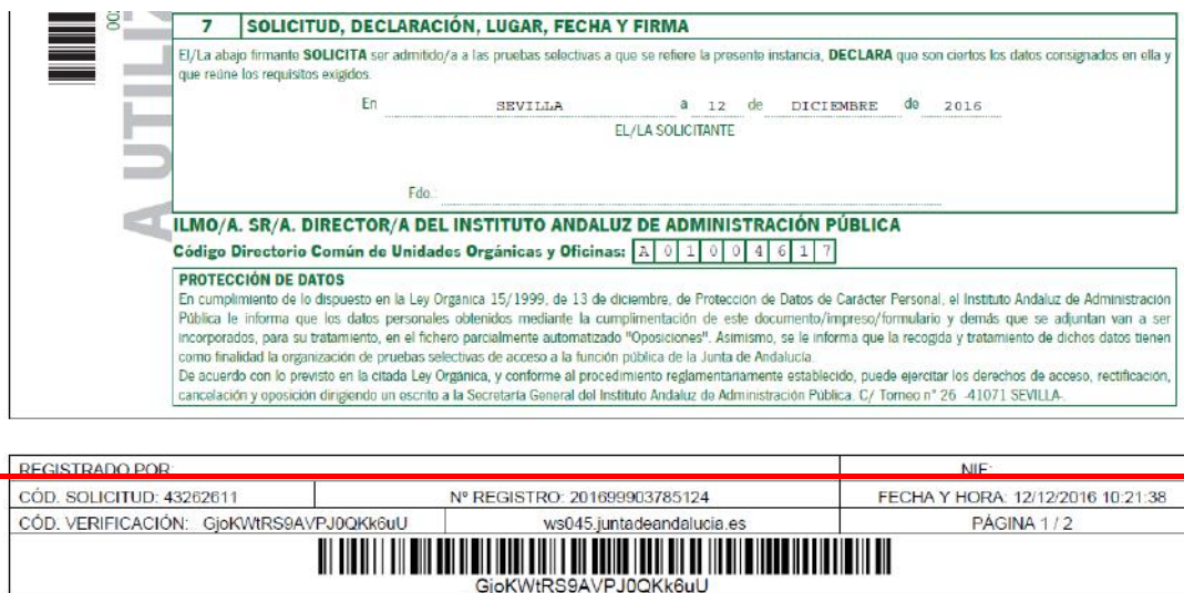
Figura 6.- Datos relativos a la presentación telemática

NOTA IMPORTANTE: Si usted no dispone código de solicitud, nº de registro, la fecha y la hora de la